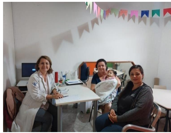
Atividade realizada: Escuta e acolhimento Data: 06/06/2024