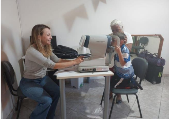
Atividade Realizada: Avaliação Oftalmológica Data: 12/06/2024