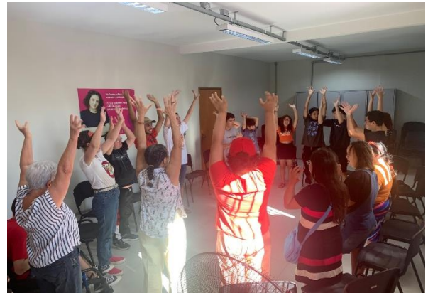
Atividade realizada: Oficina de teatro/musicalização com os jovens