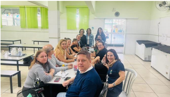
Atividade: Reunião CMDPCD Data: 05/06/2024