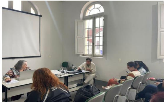
Atividade: Reunião CMDCA Data: 06/06/2024