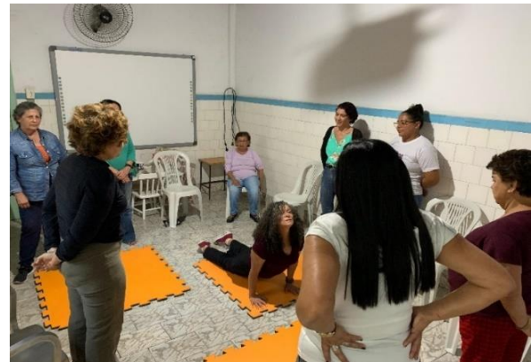
Atividade: Aula de teatro das mães Data: 19/06/2024