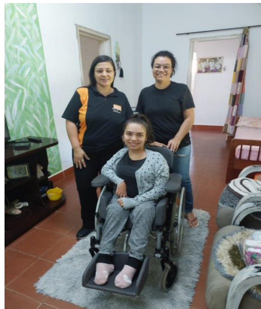
Atividade Realizada: Visita Domiciliar Data: 12/06/2024