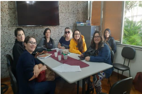
Atividade: Reunião CMAS Data: 11/06/2024