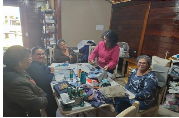
Atividade: Projeto Nossas Mulheres Oficina corte e costura Data: 10/06/2024