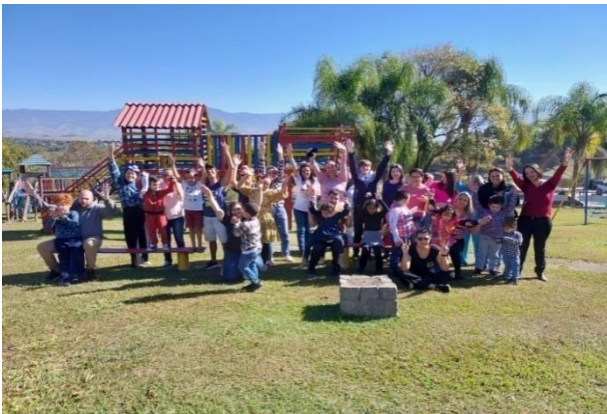
Atividade: Vivência Familiar Data: 18/06/2024