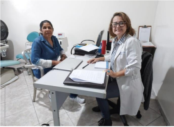
Atividade Realizada: Acolhimento Data: 05/06/2024