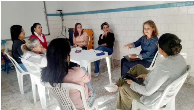
Atividade realizada: Reunião de equipe Data: 11/06/2024