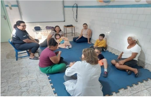
Atividade: Ver para Crer Roda de Conversa Data: 06/06/2024