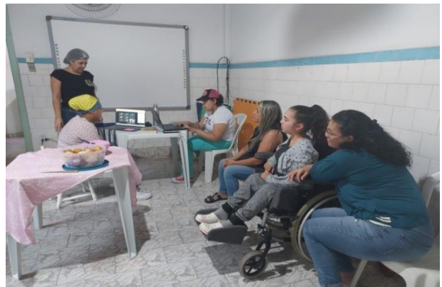
Atividade: Cozinhando em Família