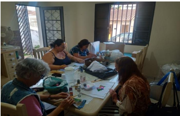
Atividade: Oficina de Pintura em Tecido