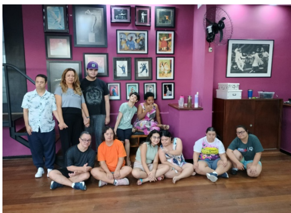
Atividade Realizada: Baila Comigo Data: 15/10/2025