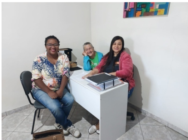
Atividade Realizada: Escuta Qualificada Data: 24/10/2025