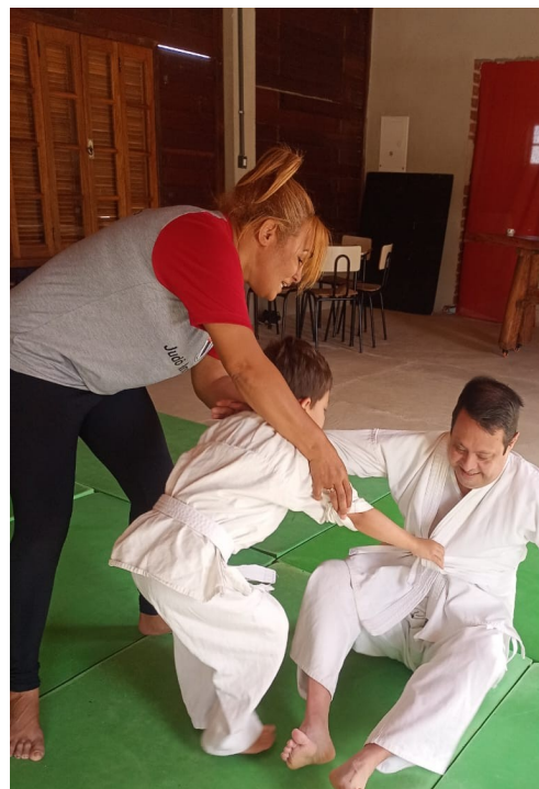
Atividade Realizada: Judô Inclusivo