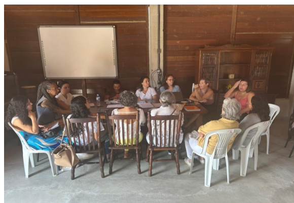
Atividade Realizada: Reunião de equipe Data: 07/10/2025