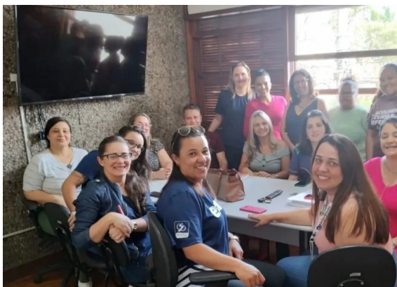
Atividade realizada: Reunião Ordinária CMAS