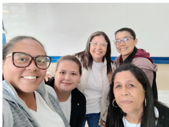
Atividade realizada: Projeto Nossas Mulheres: Momento de Cuidar e Aprender Data: 06 e 20/ 10/2025