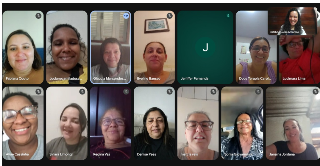
Atividade Realizada: Grupo Afetos Data: 22/10/2025