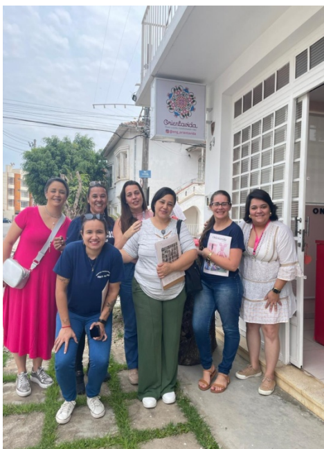
Atividade Realizada: Visita Técnica Local: ONG Orienta Vida e Pense Rosa