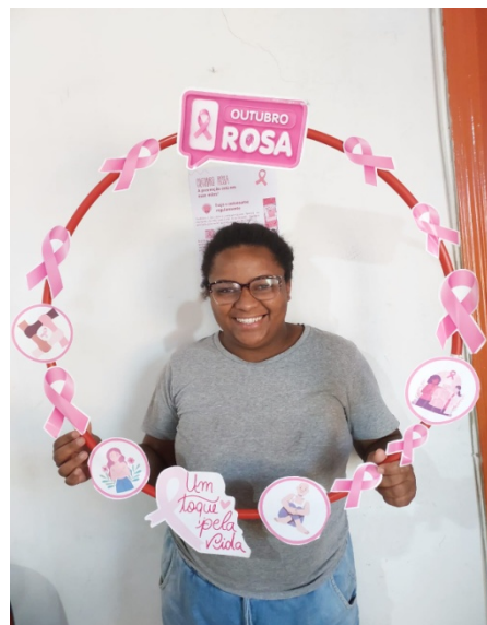
Figura 1 e 2: Registro representativo – Campanha Outubro Rosa Data: Outubro de 2025.