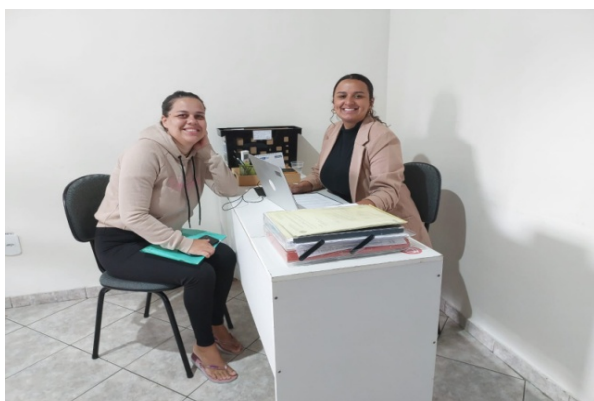
Atividade Realizada: Orientação Social Data: 04/10/2025

IMPACTO SOCIAL: As estratégias aplicadas geram impacto direto na vida dos usuários e suas famílias, assegurando acolhimento, prevenção de violações de direitos e promoção da inclusão social e da qualidade de vida.