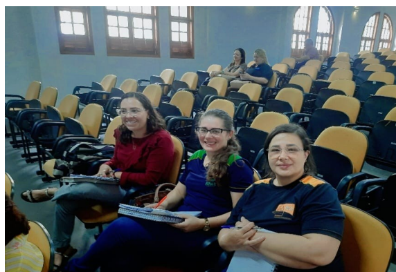
Atividade Realizada: Reunião Chamamento Público SMAS Data: 14/10/2025