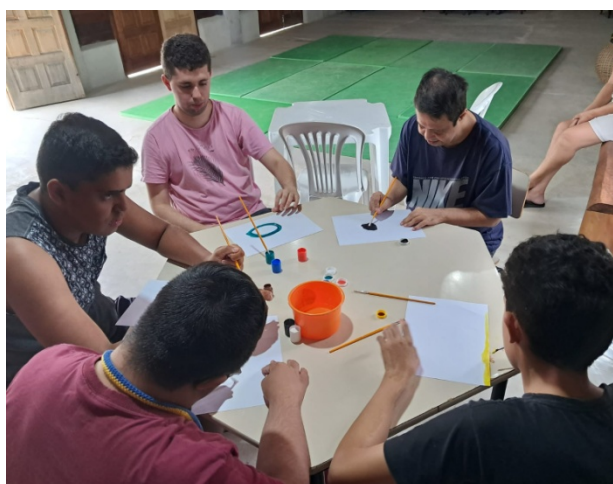
Atividade Realizada: Grupo Singularidades I e II