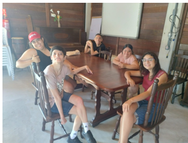
Atividade Realizada: Grupo Musicalização Data: 15/10/2025