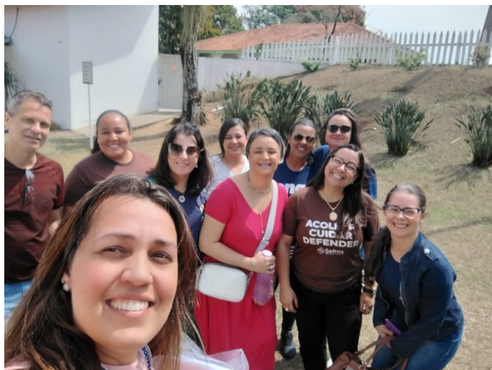
Atividade Realizada: Visita Técnica Local: Projeto Perfeita Alegria (Seminário Frei Galvão) Data: 03/10/2025