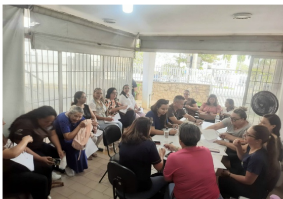
Atividade realizada: Reunião Extraordinária CMAS Data: 07/10/2025