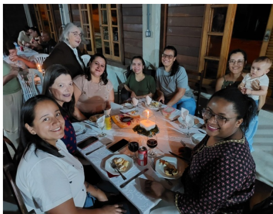
Atividade Realizada: Comemoração 19 anos do ILA Famíliares participantes Data: 03/10/2025