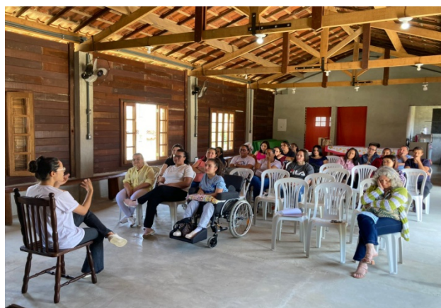
Atividade Realizada: Roda de Conversa/ Outubro Rosa Data: 16/10/2025