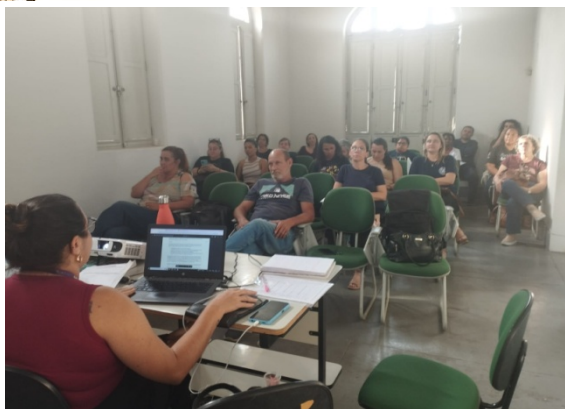
Atividade realizada: Reunião Ordinária CMDCA