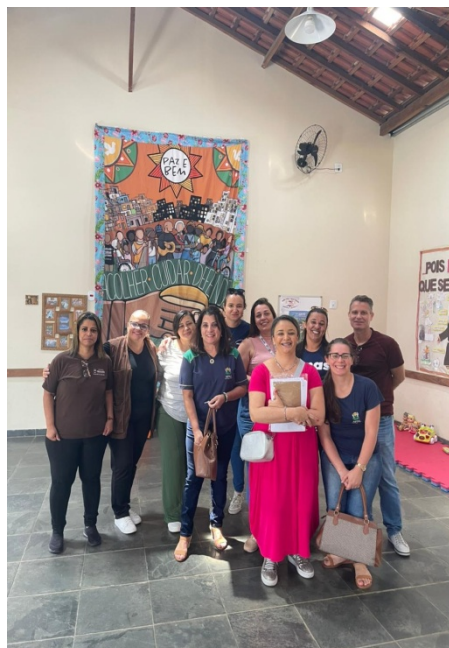
Atividade Realizada: Visita Técnica Local: Projeto Perfeita Alegria (Santuário Frei G.)