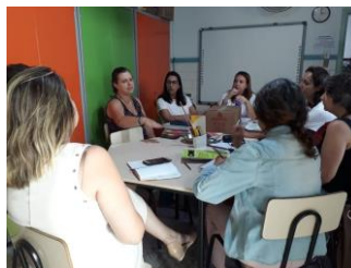
Figura 5: Reunião Clínica em 30/04/2019