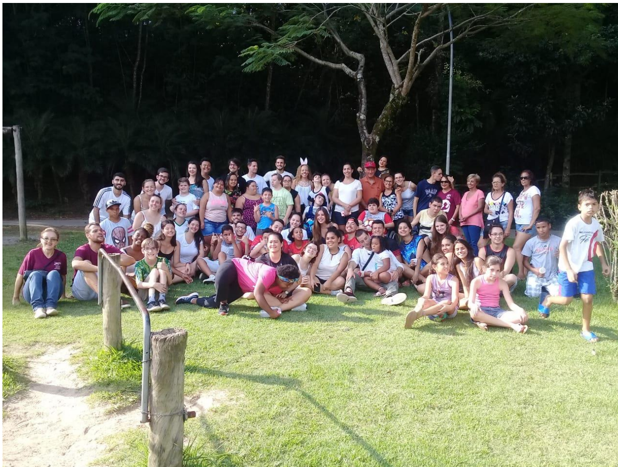
Figura 7: Páscoa solidária 12/04/2019