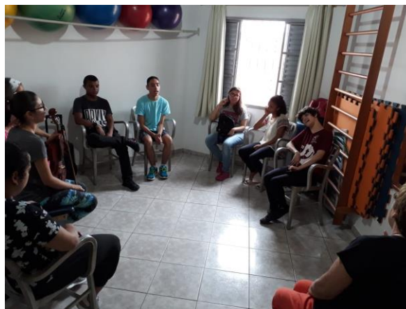
Figura 8: Oficina de musicalização 26/04/19