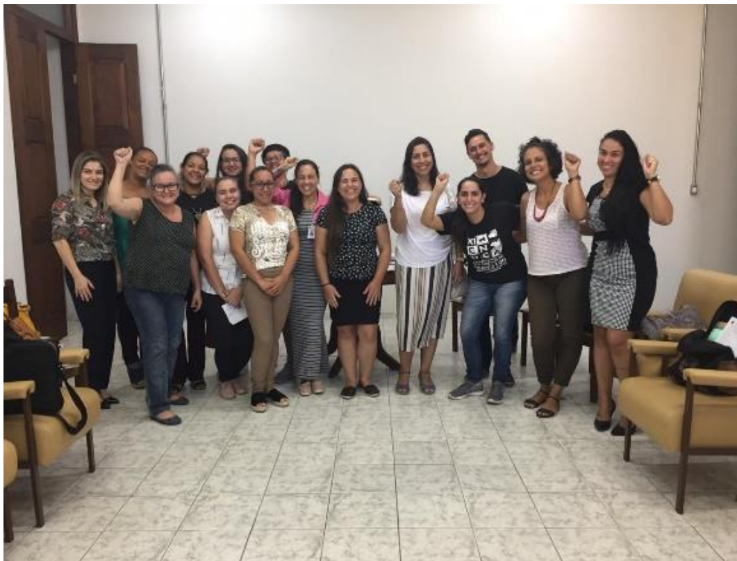
Figura 6: Reunião NUCRESS 11/04/19