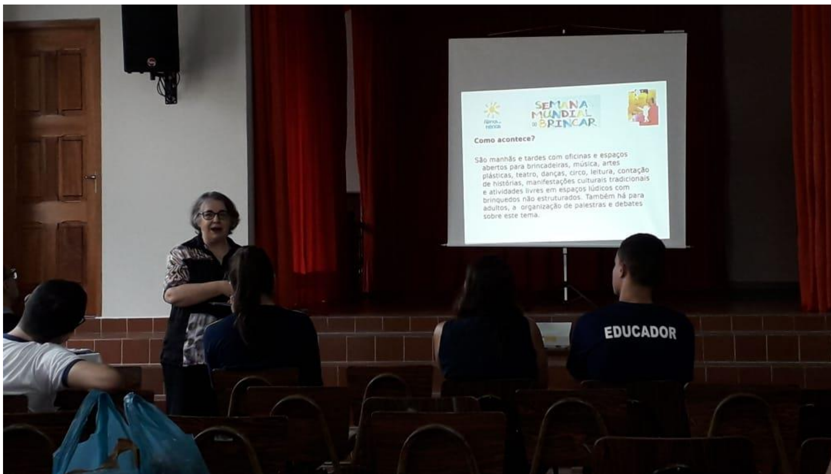
Figura 12: Reunião Semana do Brincar 24/04 /2019