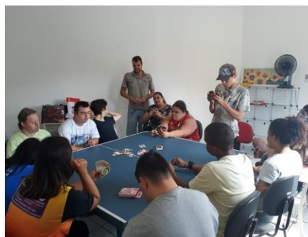
Figura 9: Oficina grupo Juventude 09/04/19