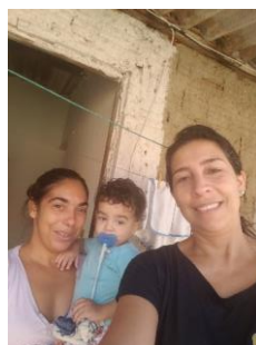
Figura 1 Visita Domiciliar em 25 de abril de 2019