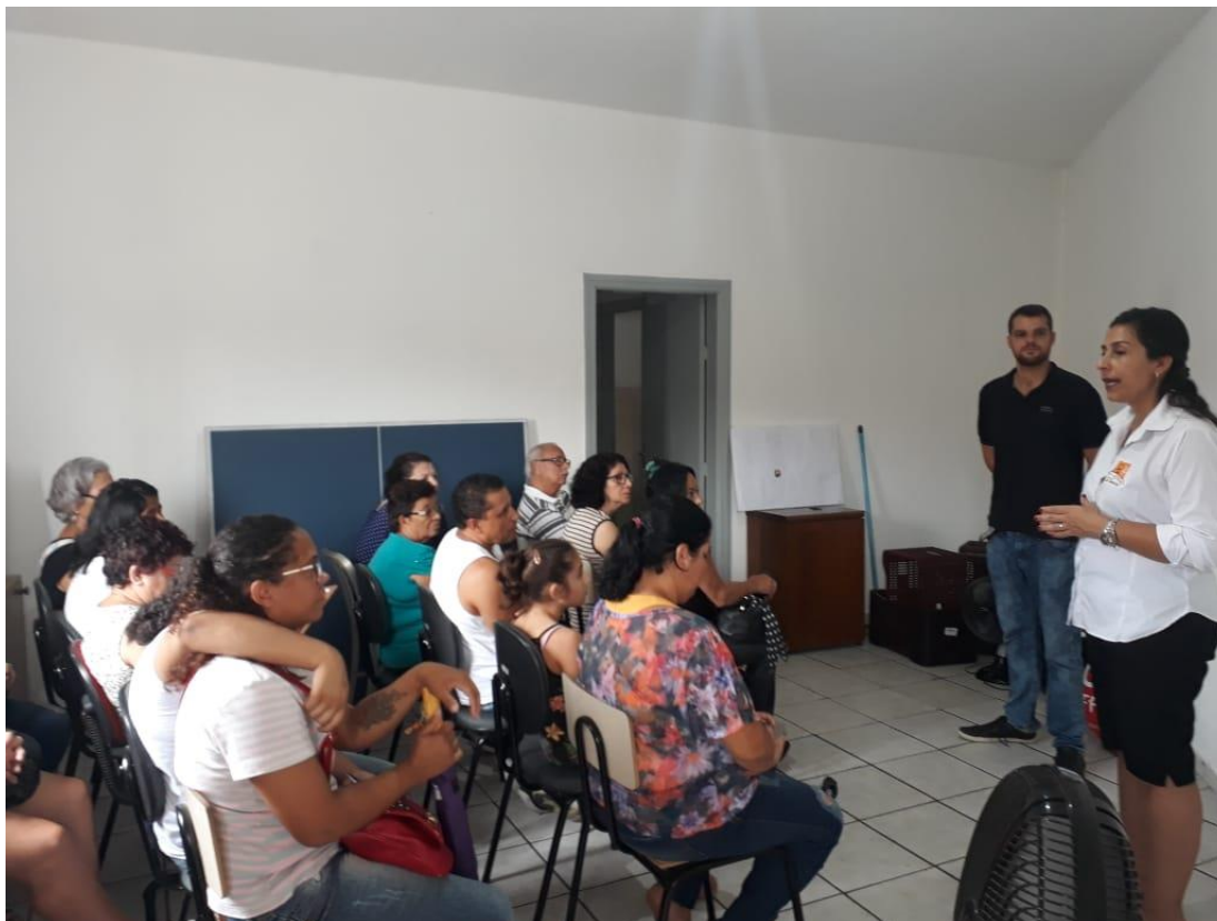
Figura 13: Dia do RECADO 08/04/19