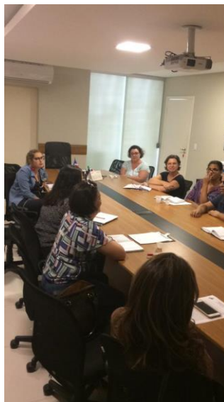
Figura 10: Reunião CMDPCD 01/04/19