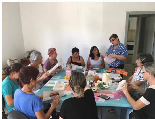
Figura 14: Oficina Pacotes de presente 10/04/19