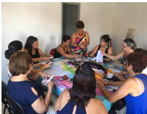
Figura 15: Oficina Kit apagão 17/04/19