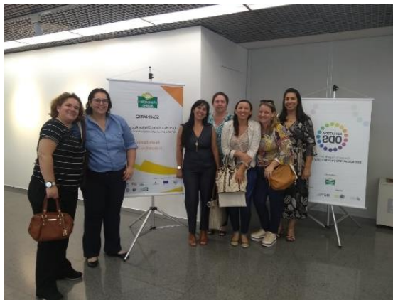
Figura 2: Curso Abrinq 16/04/2019 Rio de Janeiro