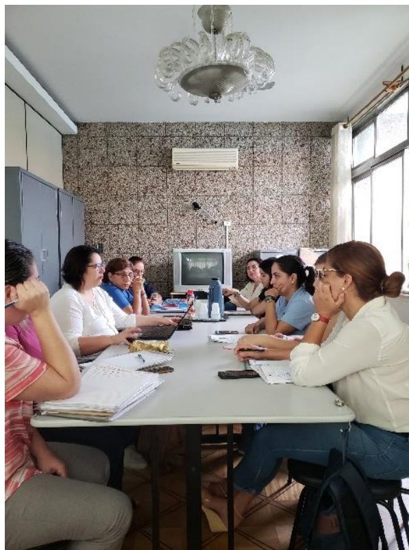
Figura 11: Reunião CMDCA 04/04/19