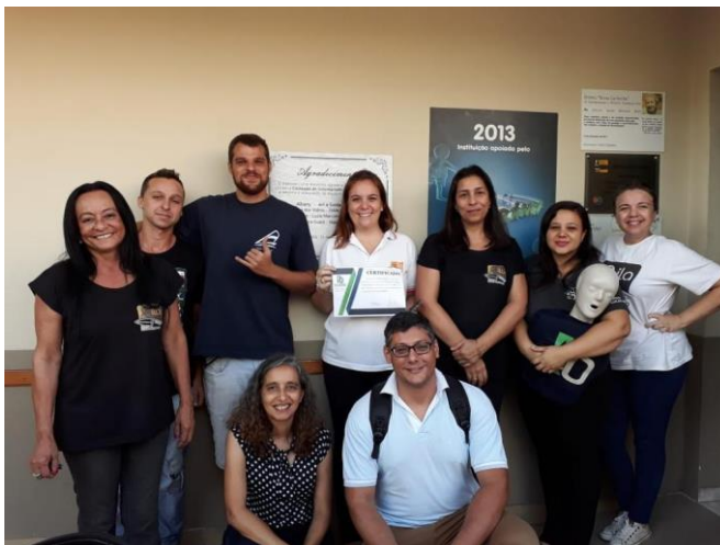
Figura 4: Curso Brigada de Incêndio 24/04/2019