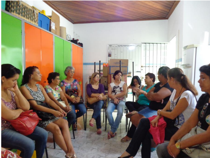
Figura 3: encontro de familiares no Projeto Família Sabe Tudo

No geral, as famílias mostraram apreensão do conhecimento, mas alguns hábitos como alimentação, higienização bucal e postura, mostraram resistência à mudança.