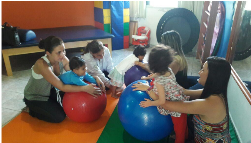
Figura 2: usuários e familiares em reabilitação baseada na comunidade em fisioterapia