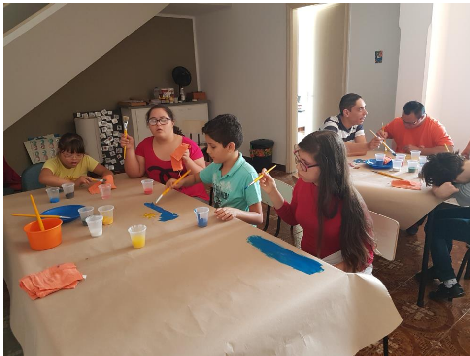
Figura 5: usuários participando da oficina de desenho.

Após a realização das oficinas, foi realizado um estudo qualitativo dos desenhos obtidos. A apresentação dos desenhos e suas interpretações foram realizadas em 24/11, com a presença de toda a equipe. O grupo NEPI teve um total de 14 encontros neste ano.