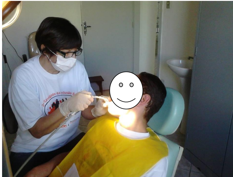
Figura 4: atendimento odontológico ao usuário do ILA