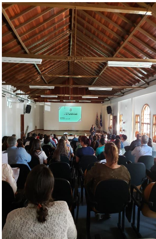
Figura 2: Encontro de conselheiros 07/08