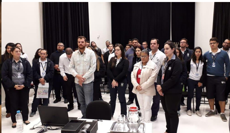
Figura 12 : PEMSA 23/08