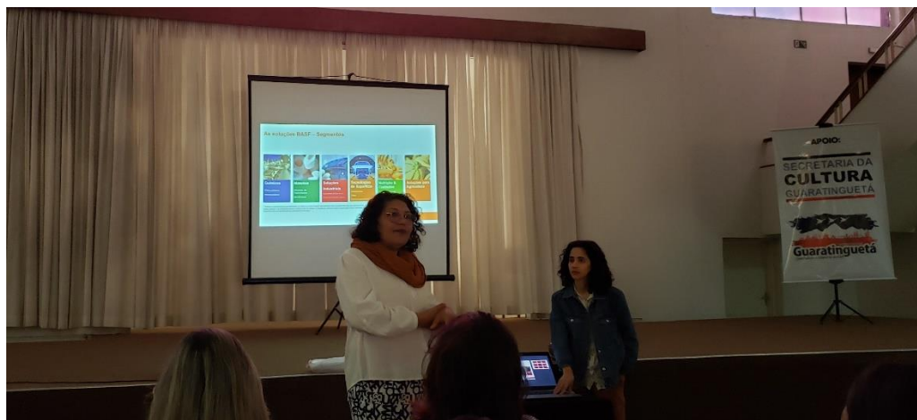
Figura 5: Workshop Basf 18/08