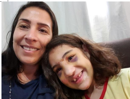
Figura 1: Visita domiciliar em 28/08/2019