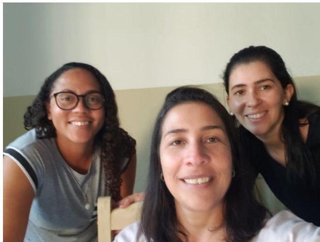
Figura 13: Reunião de mães 16/08