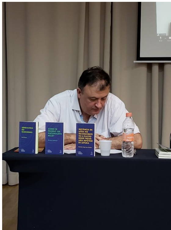
Figura 3: Colóquio sobre Autismo e Psicose SP 23 e 24/08