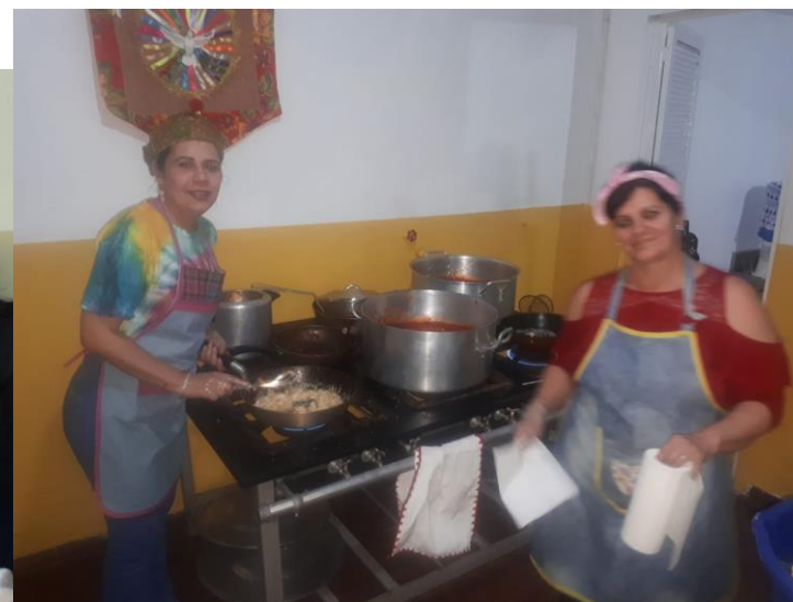
Figura 14: Oficina de nhoque 30/08