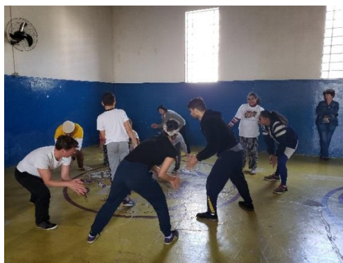
Figura 10: Vivência Anastácia Capoeira 12 a 18/08