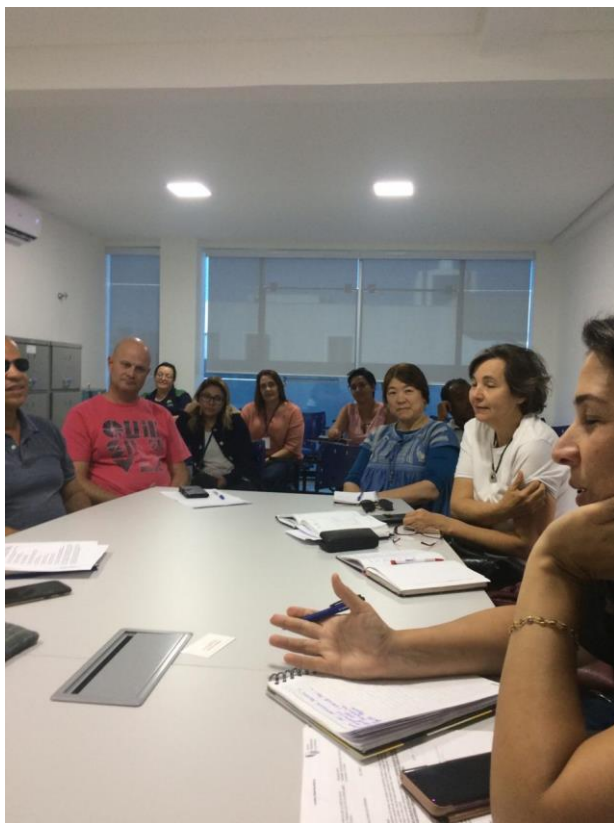
Figura 11: Reunião CMDPCD 12/08