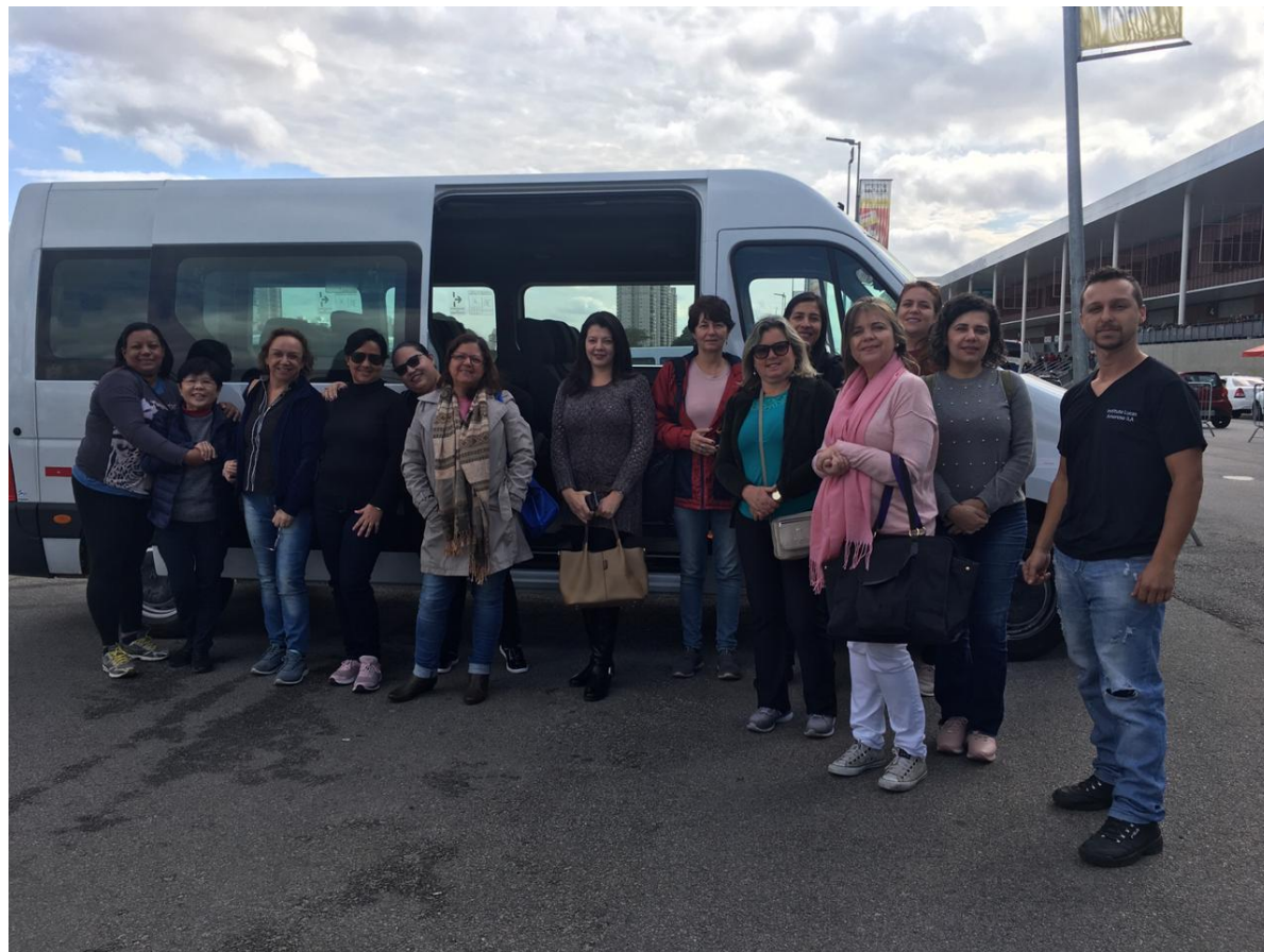
Figura 7: Mega artesanal 05/08