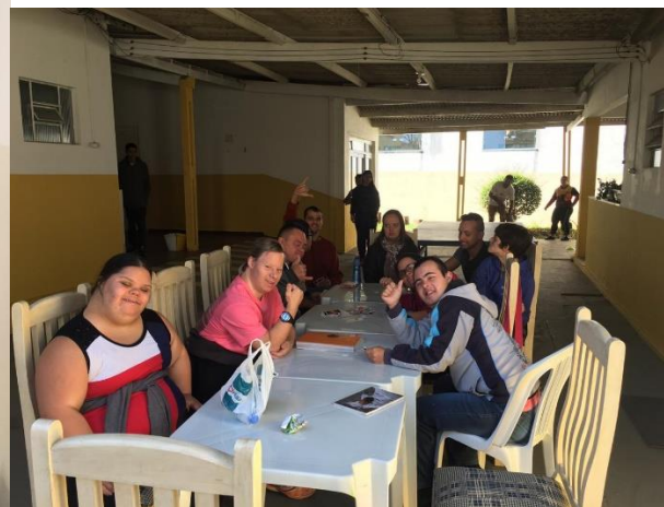
Figura 9: Grupo de jovens 13/08