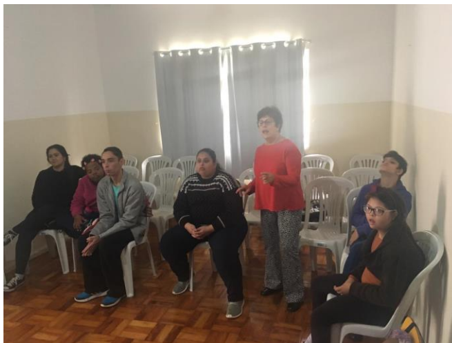
Figura 8: oficina de música 23/08