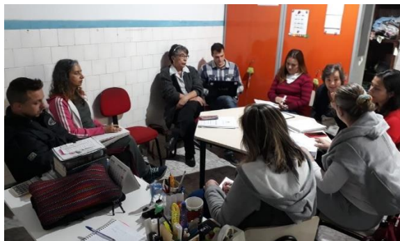
Figura 6: Reunião clínica 27/08