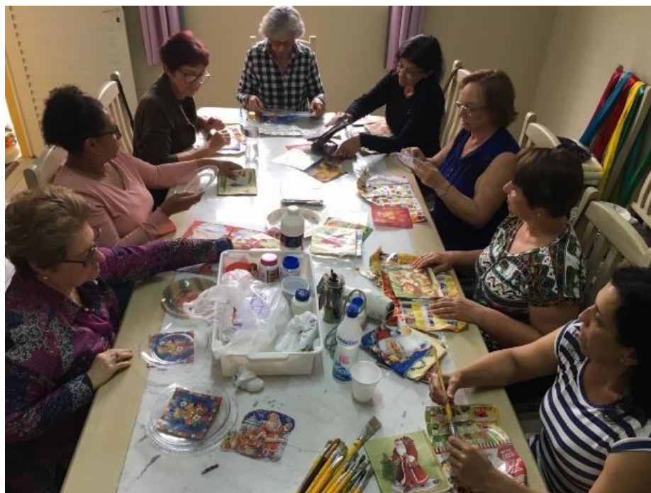
Figura 15: Oficina de decoupage 21/08