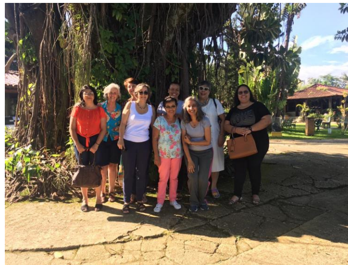
10/03 Passeio mães empreendedoras