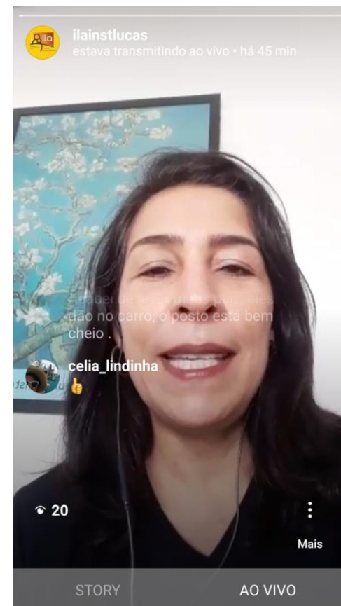
Live com as famílias via Instagram