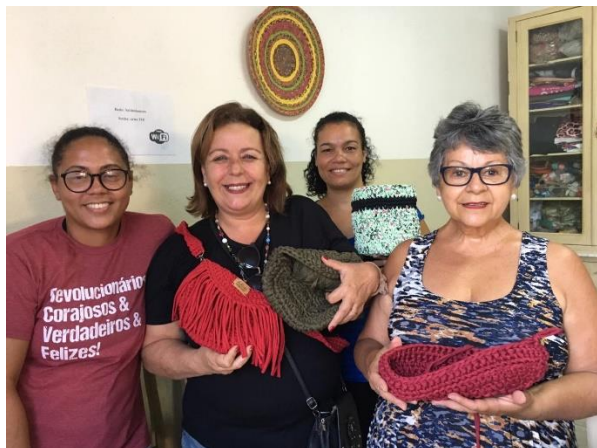
11/03 Oficina de crochê