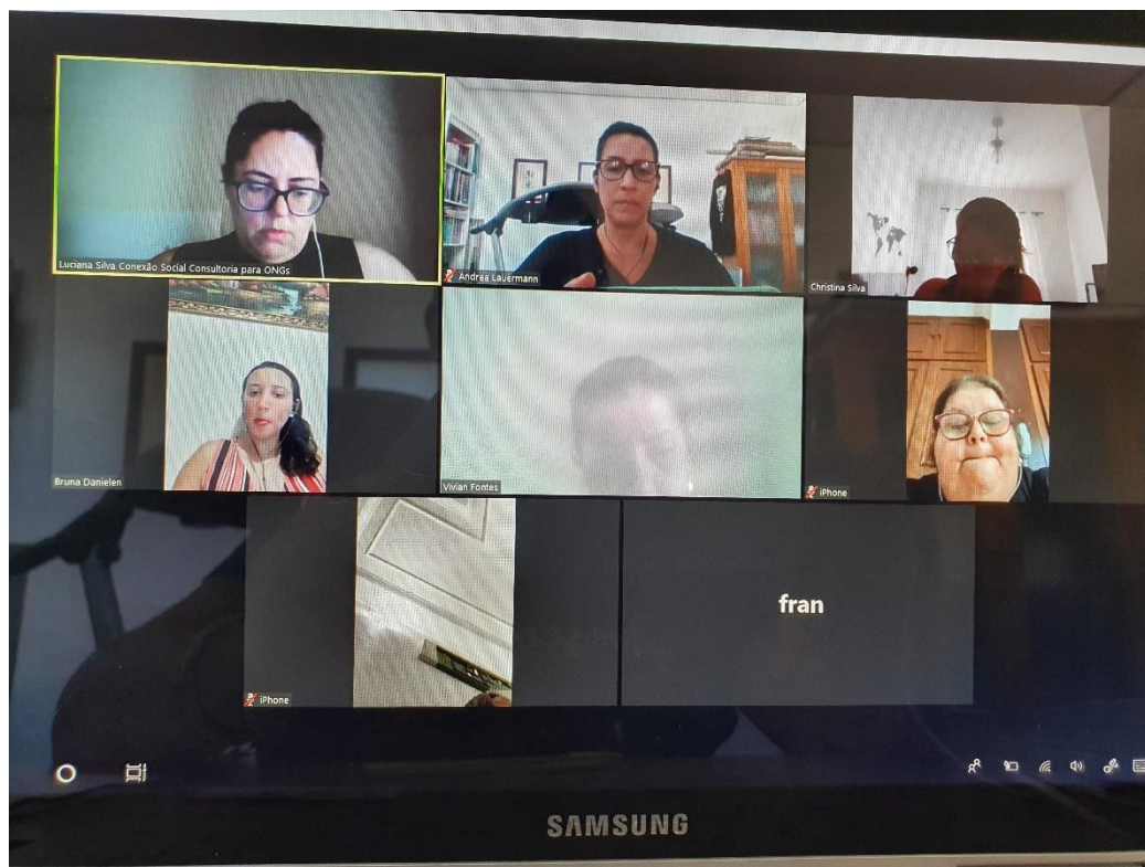
31/03 Reunião CMDCA online