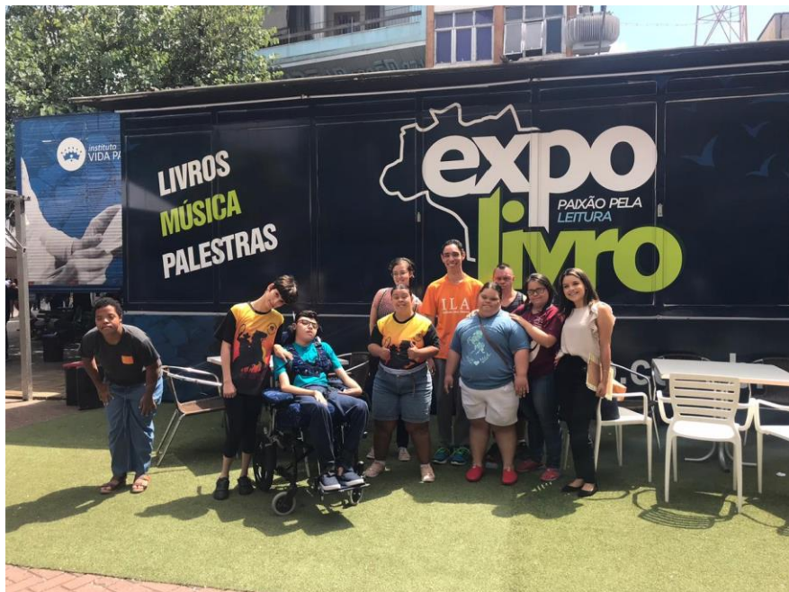
11/03 Expolivros na praça