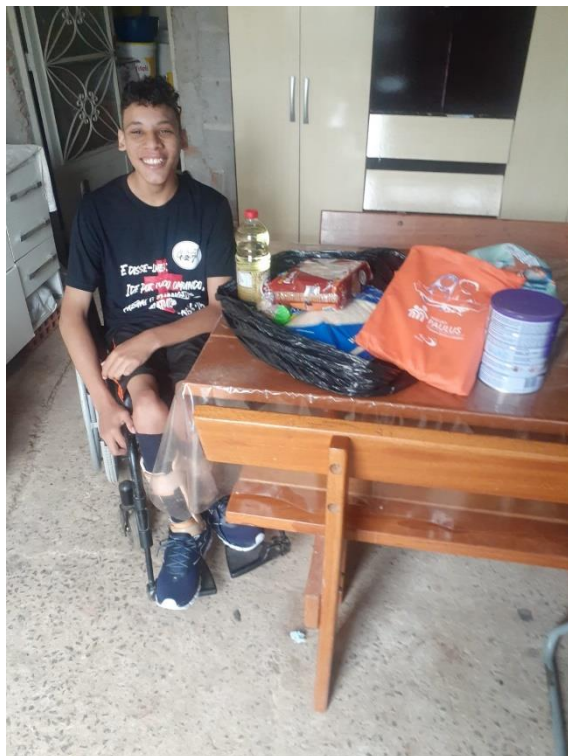
13/03 Visita com entrega de doações