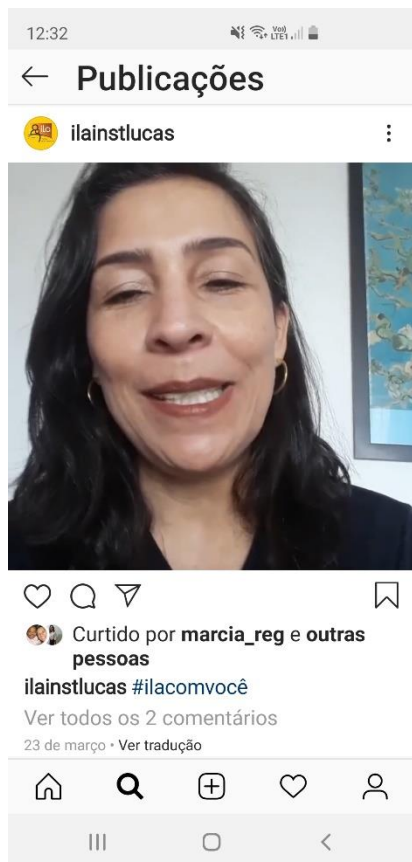
Vídeo no Instagram para as famílias