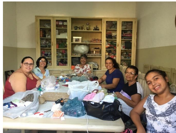
04/03 Oficina de costura