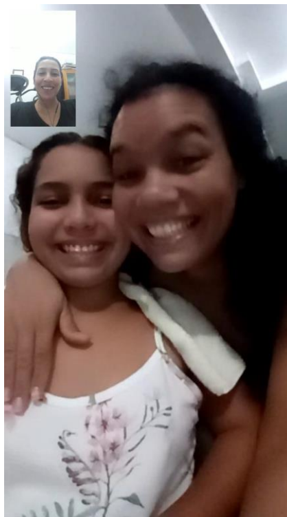
31/03 Atendimento via WhatsApp