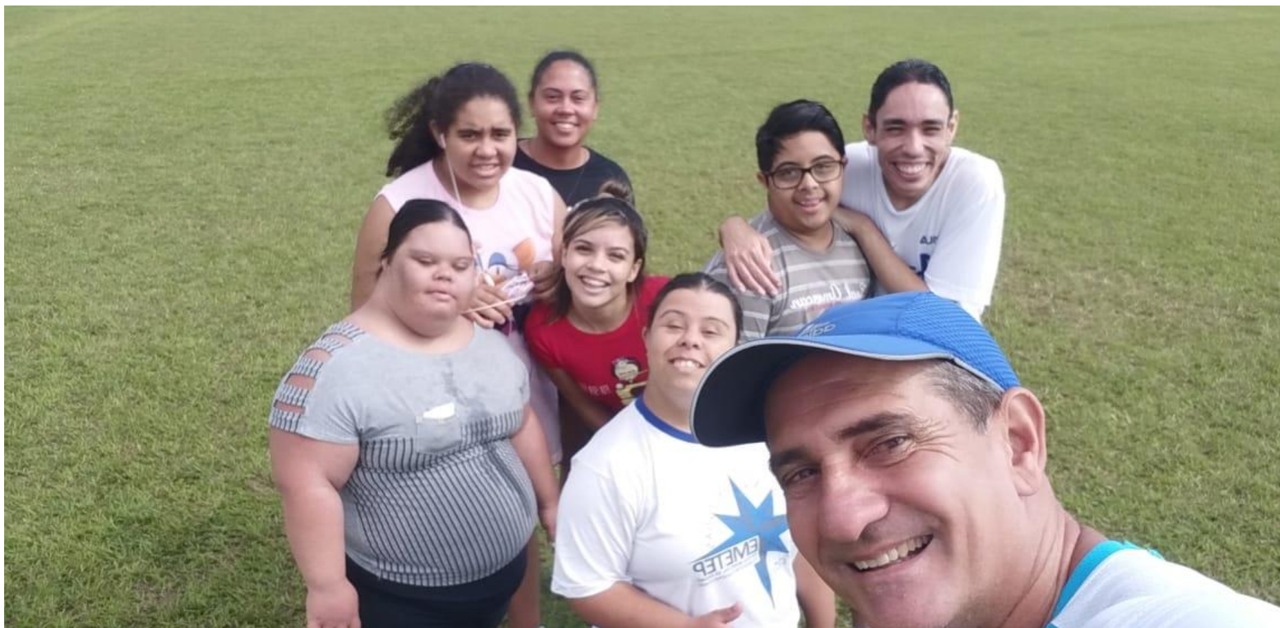
13/03 Grupo musicalização na caminhada