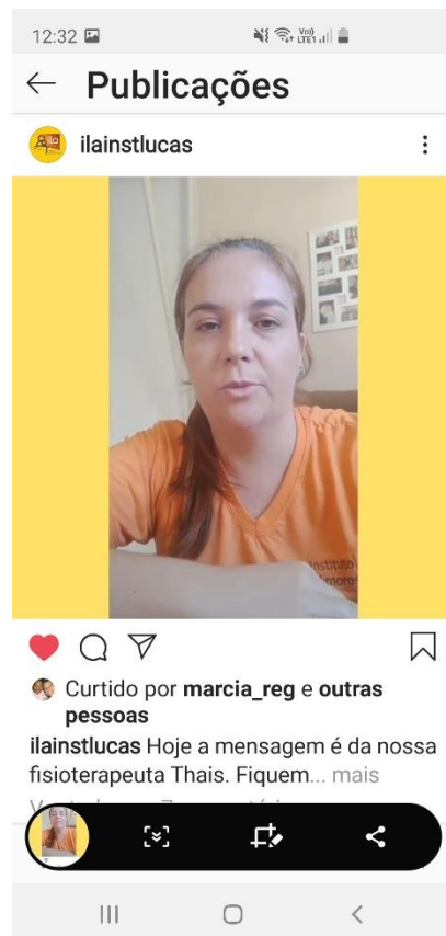
Orientações em vídeo no Instagram com a fisioterapeuta