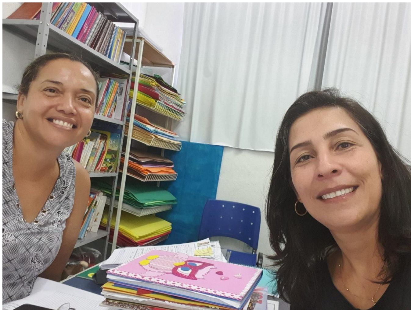
12/03 Visita Sasing