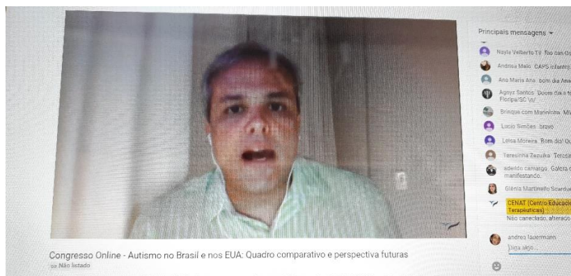
27/03 Congresso online