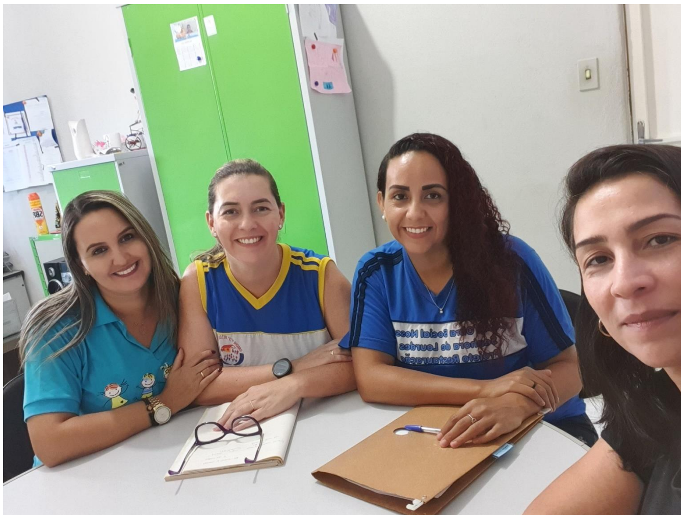
12/03 Visita creche N. Sra de Lurdes