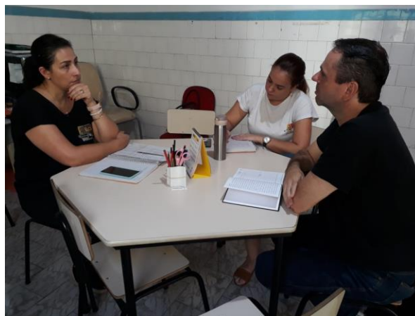
16/03 Reunião mensal