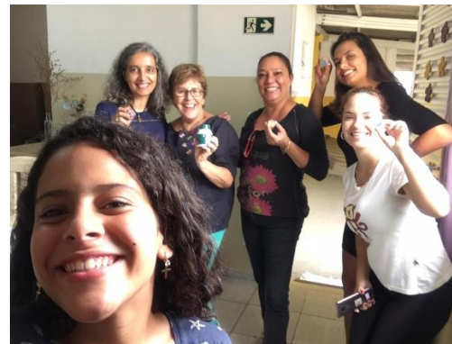
12/02 Oficina de Maquiagem