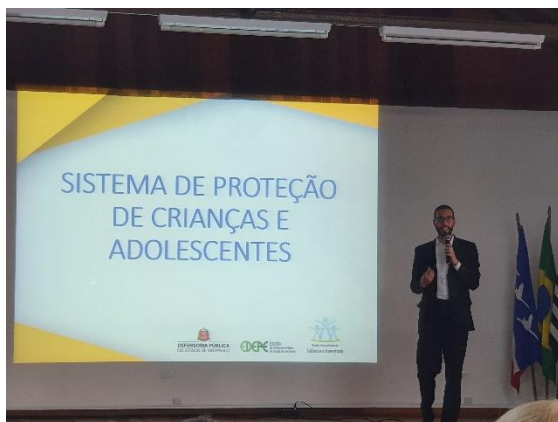
28/02 Secretaria da Educação e Defensoria Pública de SP