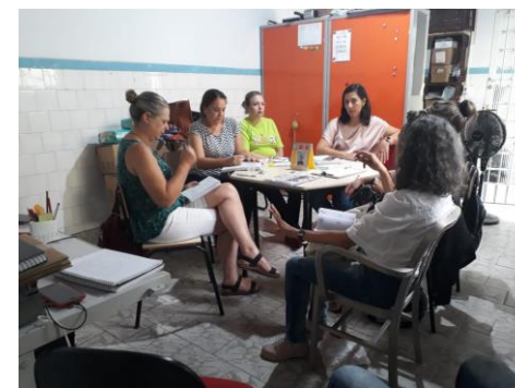
06/02 Reunião mensal