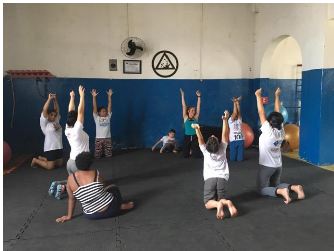
13/02 Grupo de Capoeira