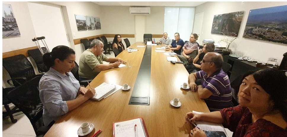
10/02 Reunião CMDPCD