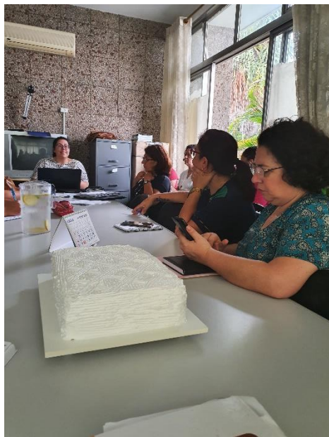
06/02 Reunião CMDCA