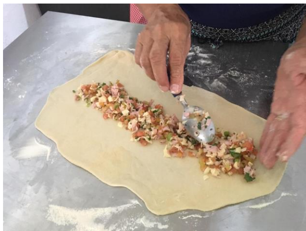
19/02 Oficina Pizza Enrolada