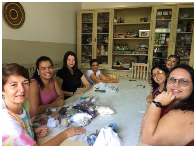
05/02 Oficina de Anjos