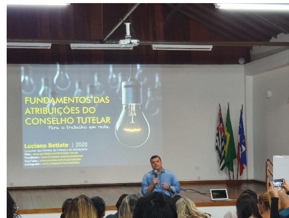
11 e 12/02 Capacitação para conselheiros CMDCA