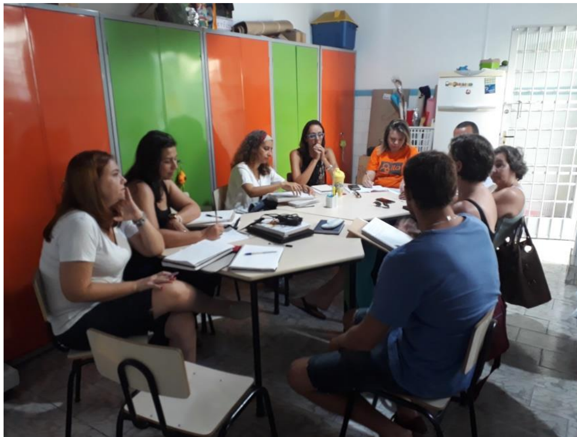
Figura 1: Reunião 12/2/19