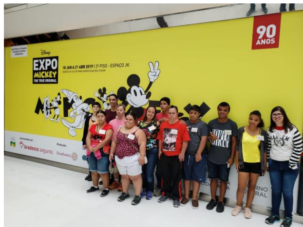
Figura 3: 04/02/19 – Shopping JK, exposição do Mickey - SP